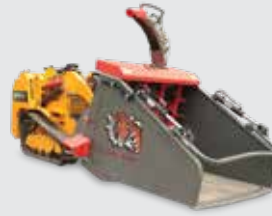
ÉLÉVATEUR DE PAILLE