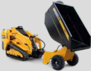
BENNE ET REMORQUE BAUMALIGHT

VENDU PAR DES CONCESSIONNAIRES POUR UN SOUTIEN LOCAL