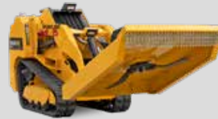
FAUCHEUSE ROTATIVE HARTATCH