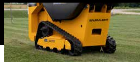
Vitesse au sol de 7,84 km/h DT515RH uniquement

Pour obtenir une liste complète des caractéristiques et fonctionnalités, visitez www.baumalight.com