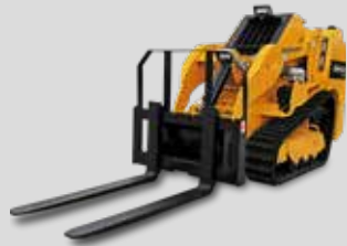
FOURCHE À PALETTES HARTATCH