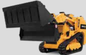
GODET 4 EN 1 HARTATCH