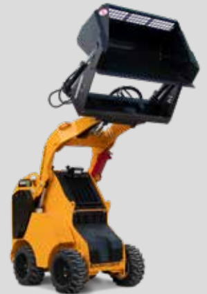
GODET À HAUT DÉVERSEMENT HARTATCH

Pour obtenir une liste complète des outils et accessoires, visitez www.baumalight.com