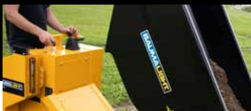
Commandes à levier DT515RH uniquement

Remorquage arrière Commande du godet hydraulique AUX Capacité du godet : 1 yard (1,2 yard en tas) Garde au sol de 7,25 po