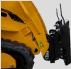
D006489 - PLAQUE DE MONTAGE AVANT BAUMALIGHT À ADAPTATEUR MÂLE POUR MINI BOBCAT