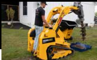
Plate-forme flottante autoportée

La plate-forme flottante autoportée offre à l'opérateur une conduite en douceur et une meilleure visibilité.