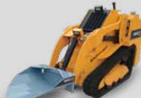
CUILLÈRE À ARBRE BAUMALIGHT