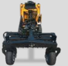
RÂTEAU MOTORISÉ WTEG