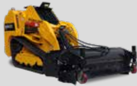
BALAI RAMASSEUR HARTATCH