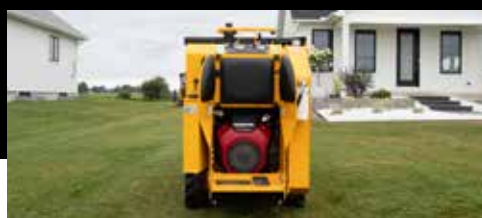
Compartiment opérateur en position debout DT515RH uniquement