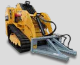
EXTRACTEUR D'ARBRES BAUMALIGHT