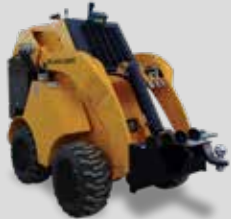
ROTULE D'ATTELAGE BAUMALIGHT