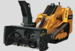
SOUFFLEUSE À NEIGE WTEG